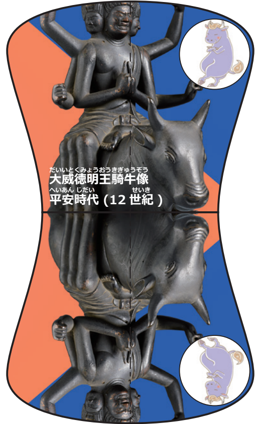
だいくとくみょうおうきぎゅうぞう 大威徳明王騎牛像 へいあん じだい 平安時代 (12世紀)