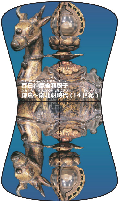
かす がしんろくしやり すし 春日神鹿舍利厨子 かまくら なんぼくちようじだい 鎌倉～南北朝時代 (14世紀)