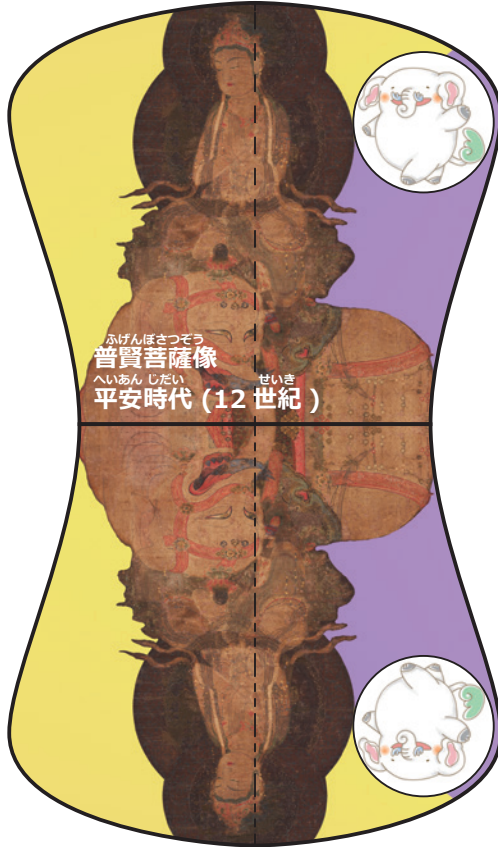
ふけんぼさつぞう 普賢菩薩像 へいあん じだい 平安時代 (12世紀)