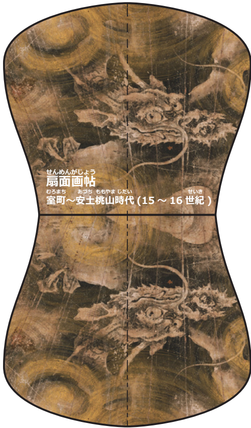
せんめんがしろう 扇面画帖 むらまぢ あつぢ ももやましだい 室町～安土桃山時代 (15～16世紀)