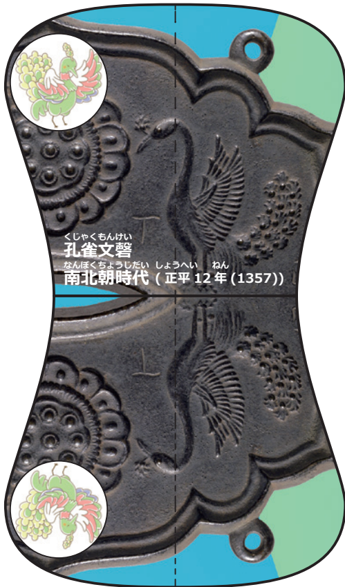
くじゃくもんげい 孔雀文馨 なんぼくちようじだい しょうへい ねん 南北朝時代 (正平 12年 (1357))